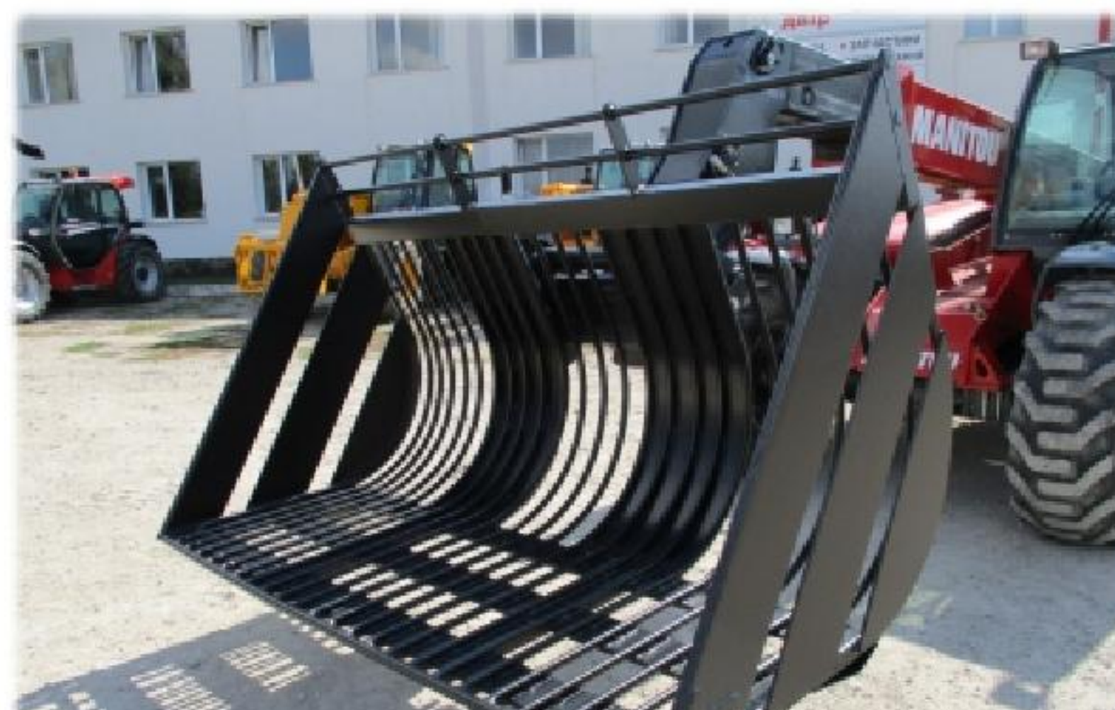
Ківш для коренеплодів