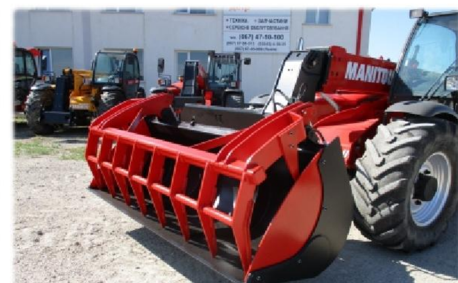
Ківш з захватом