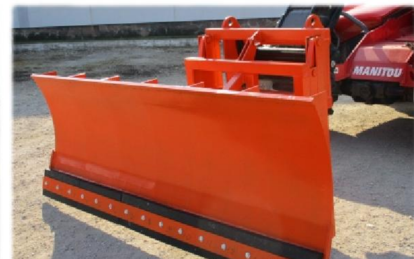
Відвал для снігу

ковші зернові; ковші універсальні; вила; ковші будівельні; ковші бурякові; ковші з захватом; захвати для лісу; захвати для тюків; снігові відвали; кран-балки; робочі платформи (люльки); інше.