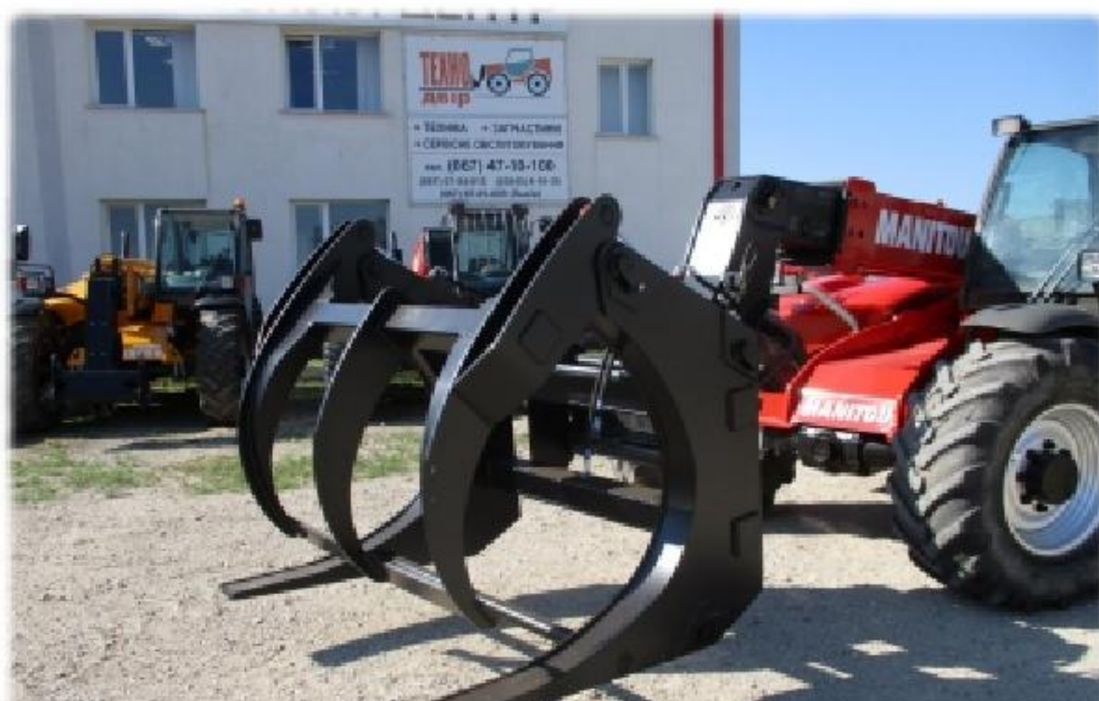
Захват для лісу